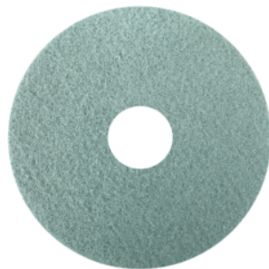
Bright 'n Water Cleaning pad