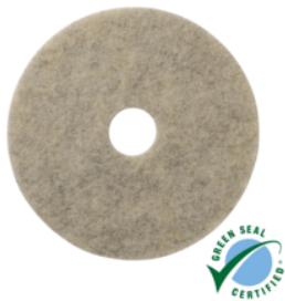
UHS pad Porko Plus Full Cycle