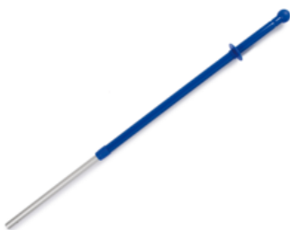
Ergonomischer Teleskopstiel Aluminium